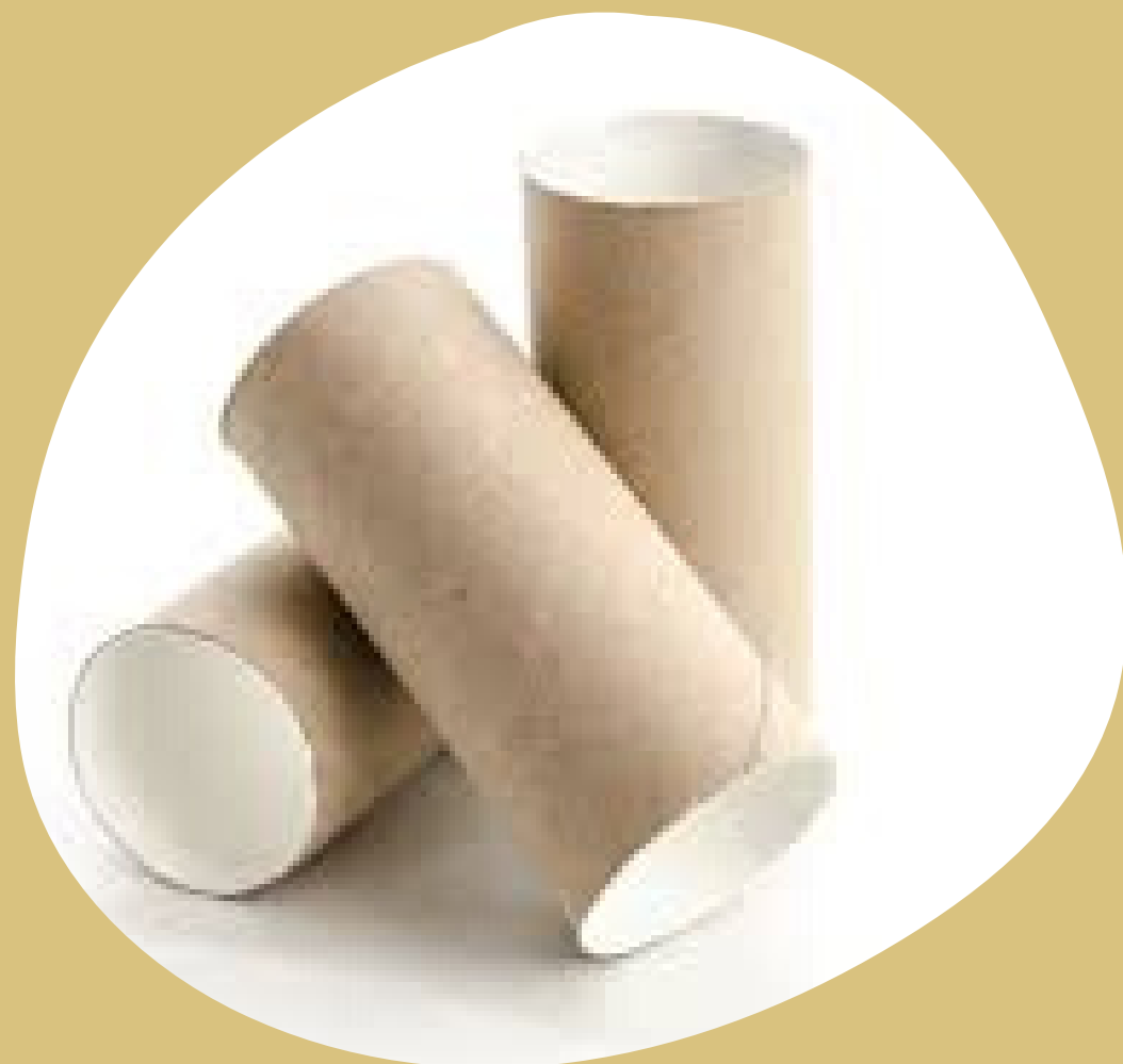
ROULEAUX DE PAPIER TOILETTE