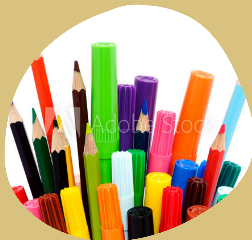
CRAYONS DE COULEUR - FEUTRES